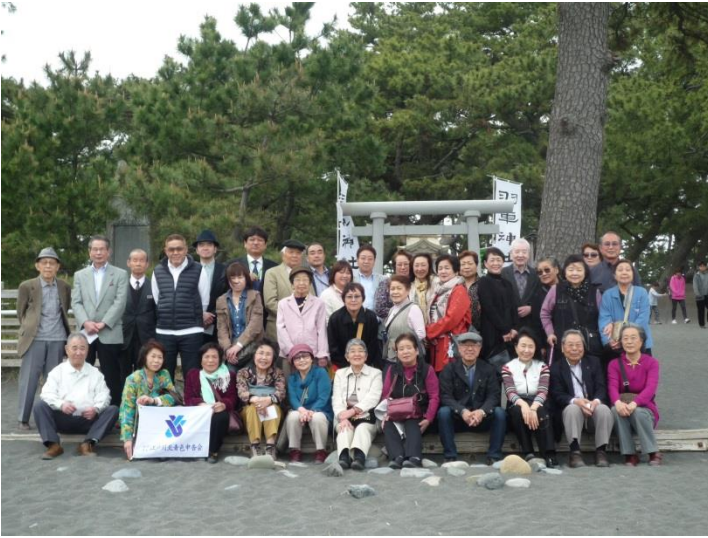
当日参加された参加者の皆さん

当日の三保の松原は残念ながら天候は曇りで、うっすらとしか富士山を見る事ができませんでした。帰りには苺狩りを行い、無事に日帰り研修を終える事ができました。参加された皆様お疲れ様でした。