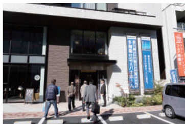
パナホーム展示場前で

昼食後、錦糸町のパナホーム展示場にて日本初の7階建てモデルハウスを見学いたしました。鉄骨住宅による防災や、最新の防災設備を実際に目の当りにすることで、参加された方々にも身体で体験して頂いたことでより現実感が増したためか、パナホーム担当者様が質問攻めになる光景がそこかしこで見られました。また久しぶりの晴天だったこともあり、ベランダでスカイツリーを眺め日当たりの良さを実感してきました。