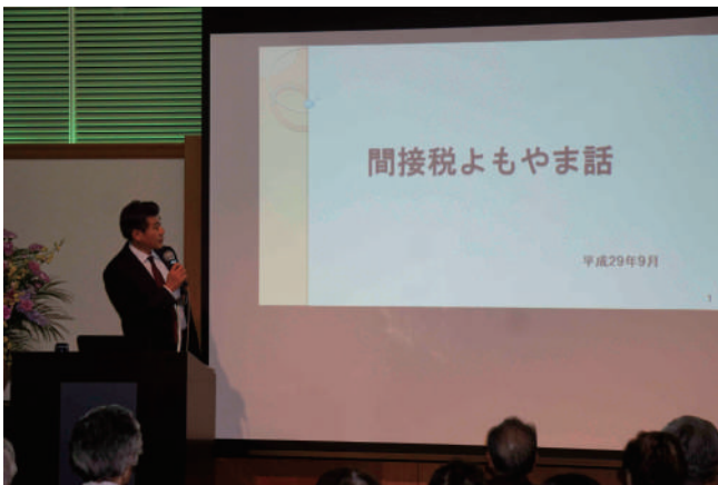
宮川署長による講演会

まつわる議論の過程や、消費税導入に合わせて廃止された間接税等、非常に興味深いものとなりました。また、ご自身で撮影