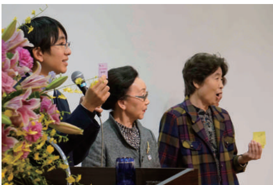
お楽しみ抽選会の様子