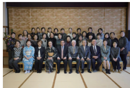
女性部新春懇親会