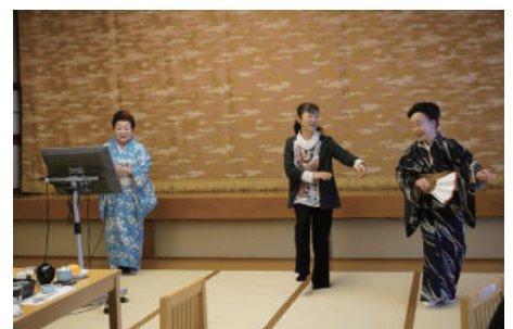
皆さんと楽しんだ舞踊