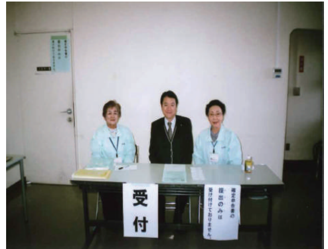
税理士無料相談・女性部受付の様子