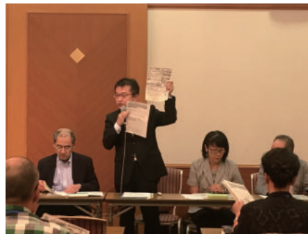
岡第一統括の説明

江戸川北税務署より4名にご出席いただき、医療費控除セルフメディケーション税制についての注意点を伺うなど、有意義な時間となりました。