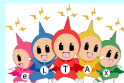
eLTAX イメージキャラクター エルレンジャー