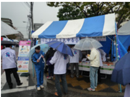
雨の中の活動する様子