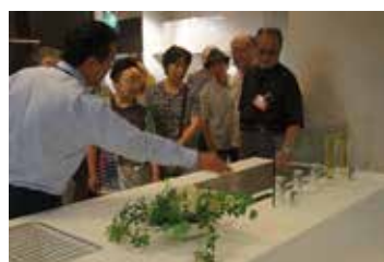
キッチンまわりの説明