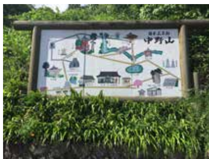
中野不動尊の参拝

ご参加いただいた皆様は大変満足して頂いた、二日間になりました。来年は、ぜひ参加してみませんか。