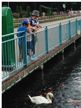
ミルクあげ体験の様子 白鳥・鯉にエサあげ体験の様子