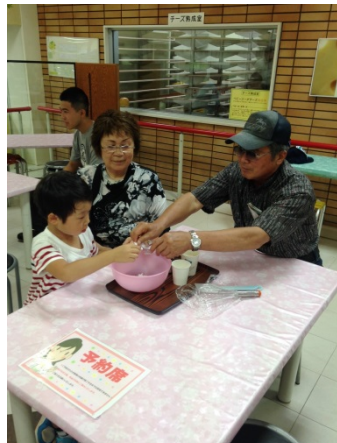
(アイスクリームづくり体験の様子)

帰りの車中では、青年部の方々が企画したビンゴゲームなどで楽しみ、参加者の皆様にはとても喜んで頂けたと思います。今後も、青年部では夏休みに親子で楽しんでいただける体験レクリエーションを企画していきます。来年も多数のご参加お待ちしております。