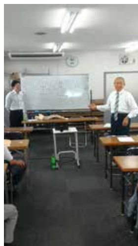
「交通事故セミナー」の様子

今後も指導委員会では会員 の皆様に関心するセミナー等を 企画していきます。 次回も多数のご参加をお待 ちしております。