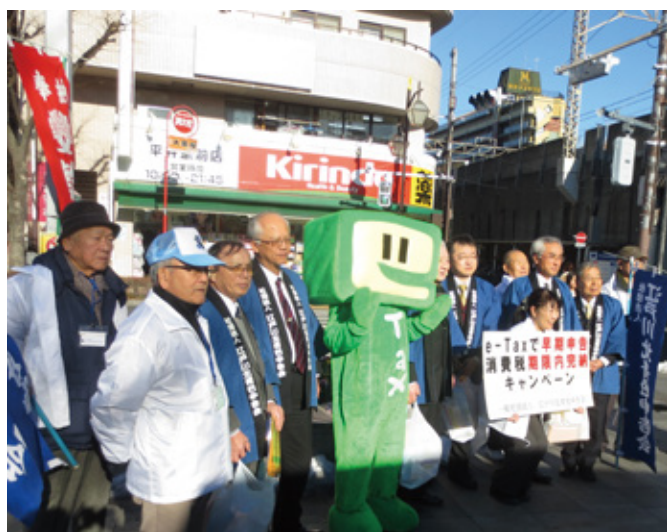
早期申告キャンペーンの様子

平成 27 年分確定申告が終了しました。江戸川北青色申告会では、1 月 25 日より決算体制となり多くの方が利用されました。事務局以外でも「早期申告キャンペーン」や、「税理士無料相談会場の受付」また、江戸川北税務署内に設けられている「青色コーナー」への協力など、申告納税に役立つ活動を行いました。 また、東京税理士会江戸川北支部の税理士先生による「電子申告代理送信」や「税務相談」などの、申告期の支援を行っていただきました。平成 27 年分が終了し、平成 28 年分へ向け青色申告会一丸となって会活動に取り組んで参りたいと思います。