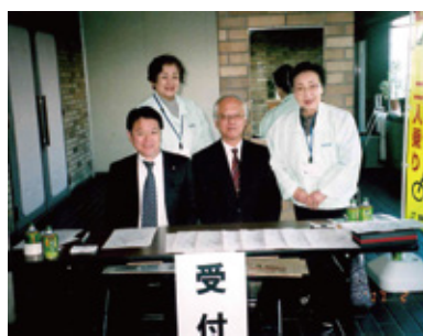
税理士無料相談会場受付の様子