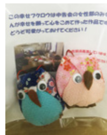
「しあわせふくろう」も大好評