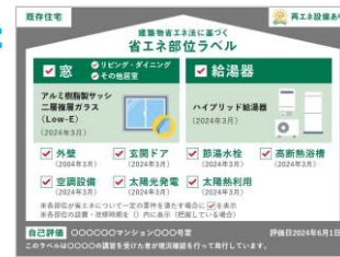
▲ 既存物件向けの省エネラベル 省エネ改修した部位がわかる (入居者募集時のアピールに)

事務局にお電話いただいても大丈夫です 賃貸物件のほかご自宅・店舗など ちょっと気になる方もお気軽にどうぞ