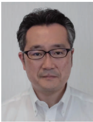
江戸川北税務署長

結びに、一般社団法人えどがわ青色申告会の益々の発展と会員の皆様方の御健勝並びに事業の御繁栄を心から祈念いたしまして、着任の挨拶とさせていただきます。