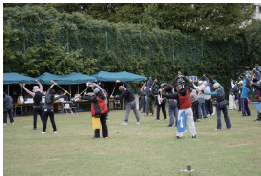
▶クラブを使った準備運動

大会としては2年連続開催と なり、今後も感染状況に応じて 大会を開催していきます。初心 者でも楽しめる競技ですので、 ご興味のある方は是非ご参加 ください。