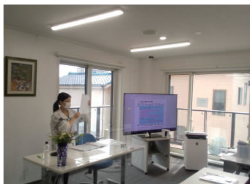
▶決算整理について説明