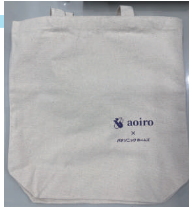
▲青色申告会 × パナソニックホームズの トートバッグ