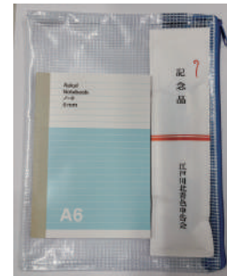
▲A5 メッシュケース・ ミニノート・ ペン