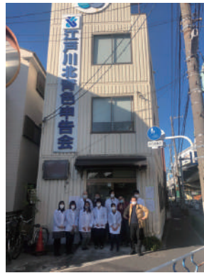
▶江戸川北青色申告会旧会館