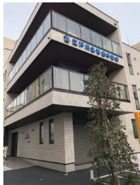
▶江戸川北青色申告会新会館

会長 はい。令和3年1月から新築した会館で業務を行っています。当会館2階で会員の記帳相談業務を行い、3階では集合形式的研修を行っています。窓が大きくて風通しがいいですよ。換気は万全です。コロナがなければ落成式をしたかったですね。