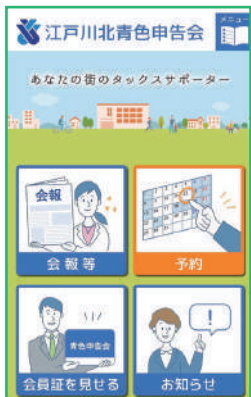
▶青色アプリ画面イメージ