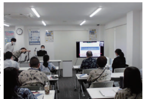
▶インボイス制度説明会

昨年はいくつかの青色申告会をつないで、東京上野税務署から講師をお迎えし、青色申告会職員向けのインボイス説明会を行いました。最新の設備を備えていますので、会員向けのオンラインサービスも充実させたいです。