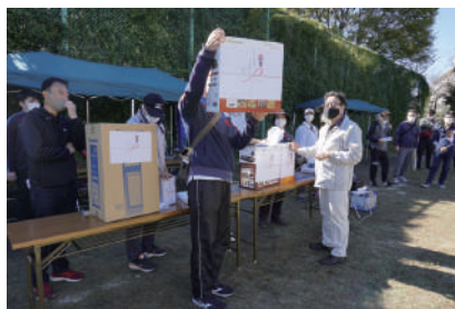
▲お楽しみ抽選会で景品を披露

今後も感染状況に応じて大会を開催していきます。初心者でも楽しめる競技ですので、ご興味のある方は是非ご参加ください。