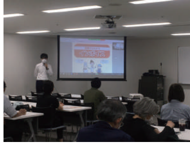
▲冊子「基礎からわかるインボイス」に沿って説明

の手続きの仕方・今後の影響などを紹介するもので、課税事業者の方はもちろん免税事業者の方にも関係する制度であることをお伝えできました。