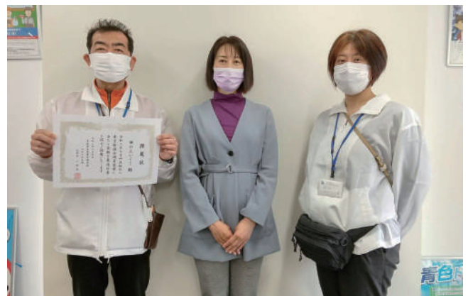
▲（真ん中）田の上都議会議員

※ 総額表示について、更に詳しくお知りになりたい方は、財務省HPの「消費税の総額表示義務と転嫁対策に関する資料」ページをご覧ください。