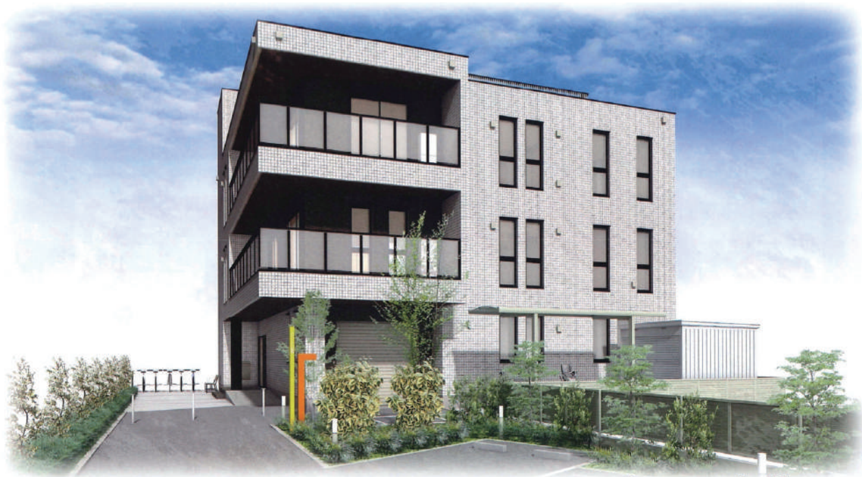
◆新会館完成イメージ図 Produce by Panasonic Homes