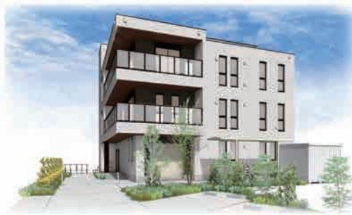
▲江戸川北青色申告会・新会館イメージ

新会館 建設工事始まる 江戸川北青色申告会新会館建設に伴い、2020年5月30日(土)に地鎮祭が行われました。 また、12月25日(金)完成予定となります。新会館のオープン日等については改めてご報告させていただきます。