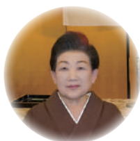
税務署長感謝状 所 環