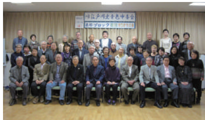
▲参加者のみなさん

本大会に限らず各ブロックでは様々な催しを行っておりますので、皆さまお誘い合わせの上、是非ご参加ください。