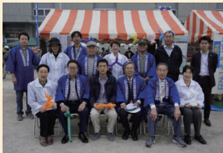
▲中央・一之江ふるさとまつり