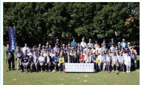
▲総勢 74 名が参加

チームでプレーを進めるため、初めて顔を合わせた方同士でも終盤にはすっかり打ち解けている様子でした。終盤に恒例のお楽しみ抽選会も行い、今回はテーマパークのペアチケット獲得を巡り大いに盛り上がりました。次回のご参加もお待ちしております。