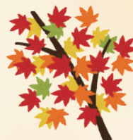
▼小松川平井ふるさとまつり