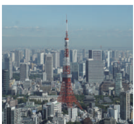
▲大展望からの眺め