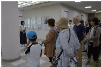
▲パナソニックホームズつくば工場にて 説明に耳を傾ける参加者

昼食後はJAXA班とアウトレット班に別れ、前者は「きぼう」の管制室や宇宙服レプリカなどを見物し、貴重な良い思い出として参加者の心に残ったようです。