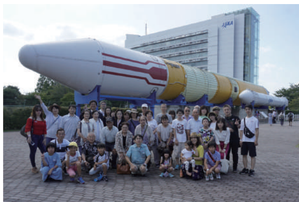
▲JAXA 筑波宇宙センターにて

8月4日(日)に開催し、69名が参加しました。午前にはパナソニックホームズ様のつくば工場を見学し、「強さ」「くらしやすさ」の造りの2つの強みを学びました。他に地震体験スペースや賃貸住宅のモデルルームがあり、参加者は時折「こんなところに住みたい!」と歓声を上げながら非日常の空間を楽しんでいました。