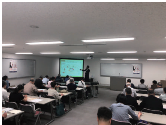
▲大勢の方にご参加いただきました