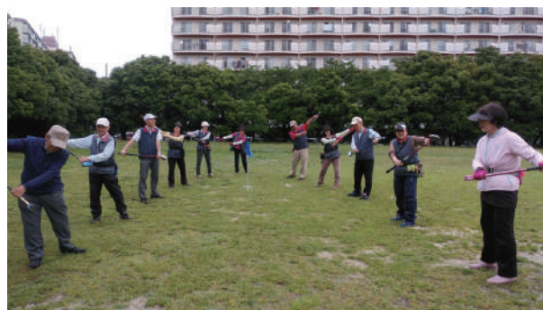
▲準備運動で備えます