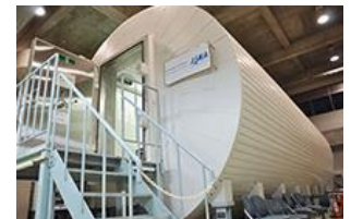
<JAXA宇宙センター>宇宙開発についての見学を通し、化学の最先端を体感