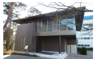
<パナソニックホームズつくば工場>最新の快適住宅についてご見学頂きます