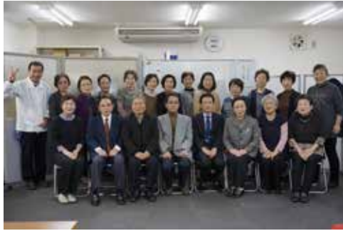
参加された女性部の皆様