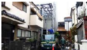
足場がなければ、その分大きな建物が建てられます。

パナソニックホームズの住まいには2つの構法があります。HS構法は、狭く入り込んだ場所でも、部材を小型トラックで搬入して、大型クレーンを使わず手組みで建築が可能です。また、NS構法ならではの「無足場工法」なら、大切な敷地いっぱいに建築できます。