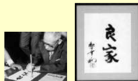
理想の住まいづくりに思いを託した創業者の揮毫

2018年4月1日よりパナホームは「パナソニックホームズ」に社名変更し、さらなる飛躍に踏み出しました。