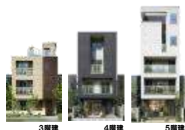
3階建 4階建 5階建

9階建まで可能な多層階住宅なら、容積率を最大限に活用できます。賃貸住宅やお店を併用すれば、安定した賃貸収入を建築費の返済に充てることができます。