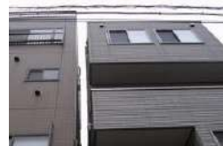
密集地で大型クレーンを使わずに施工(HS構法)。足場を使わず、隣家との間隔がわずかでも建築が可能(NS構法)。