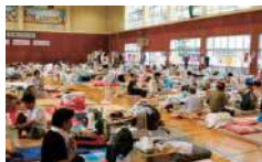
不便が続く避難所生活

大きな地震の力を繰り返し受けても建物の構造体は損傷しません。被災直後から避難所で不便な生活を強いられることなく、わが家での生活と仕事が続けられた例もあります。