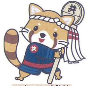
イメージキャラクター 共助くん