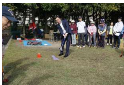
パナソニックホームズ赤羽様の始球式