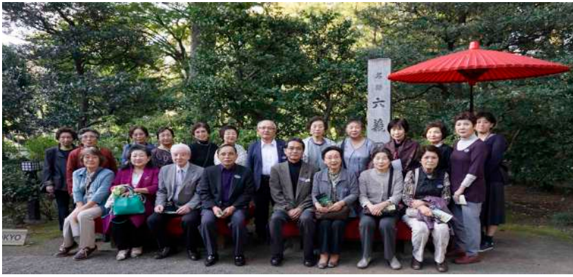
六義園での記念撮影

10月25日（木）秋晴れに恵まれ、26名の参加で「都内めぐり」に行ってみました。まず部長の挨拶から始まり、会長の研修を受けながら赤坂迎賓館に向かいました。煌びやかな西洋宮殿建築に日本風な要素が融合した様を、時間を忘れて観て廻りました。その後、楽しく昼食を摂り、東京タワーでは景色も早々にお土産を購入したり、広大な六義園の散策を楽しんだり、より一層親睦を深めた一日となりました