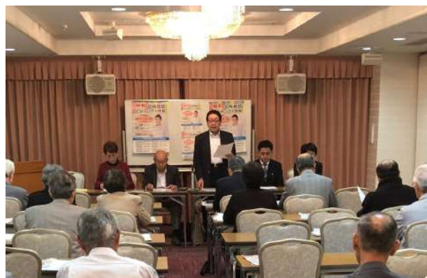
中央ブロック勧奨説明会