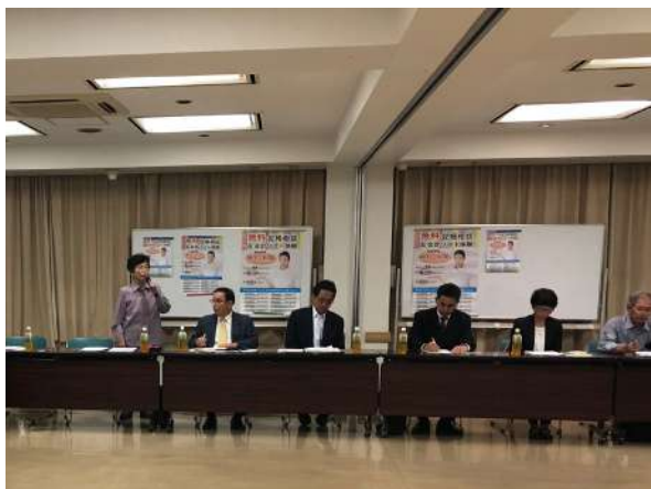
東部ブロック勧奨説明会

各支部ブロックとも、一人でも多くの方に青色申告会をご利用頂き、会の発展に会員増強を確認した会議となりました。お近くの方で会をご利用頂いていない方また記帳の方法に不安のある方など、青色申告会へお気軽にお越し頂くようお願いいたします。