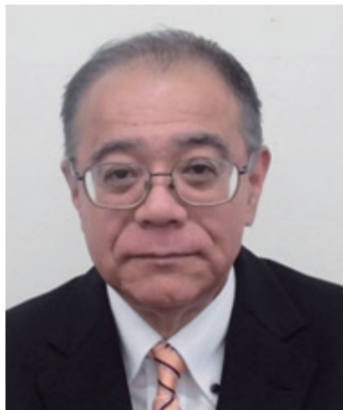
江戸川北税務署長 川原 由紀人様

発行：一般社団法人江戸川北青色申告会 〒132-0025 江戸川区松江 2-23-13 TEL03 (3656) 0621 FAX03 (3656) 1104