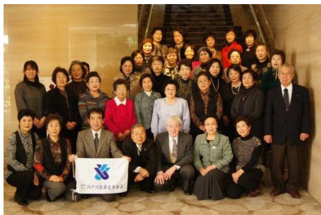
新春親睦会での集合写真

女性部では、申告会の様々な活動を協力して頂ける女性部員を募集しております。活動にご興味ある方は、本部まで是非ご連絡ください。