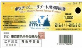
東京ディズニーリゾート特別利用券