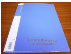
青色申告会特製クリアブック