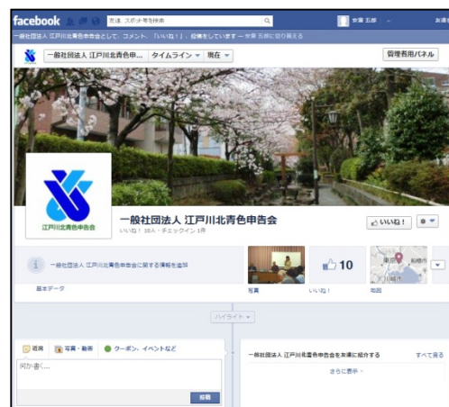
当会 Facebook ページ