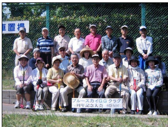
ブルースカイクラブ1周年記念大会に参加された皆様