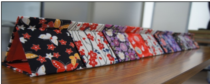
「ミニちりめん鏡」完成写真