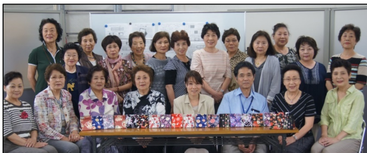
手芸教室に参加された皆様

女性部では、毎年手芸教室を開催しております。ご興味ある方は、事務局までお問い合わせください。