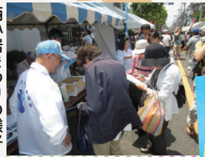
西小岩まつりの様子