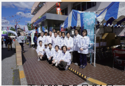
平成 30 年 5 月 24 日