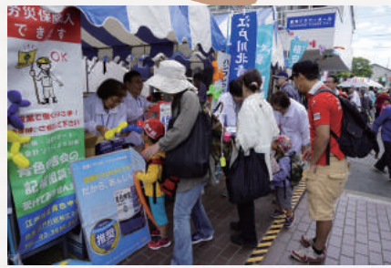
鹿骨区民館まつりの様子