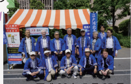
平成 30 年 5 月 27 日