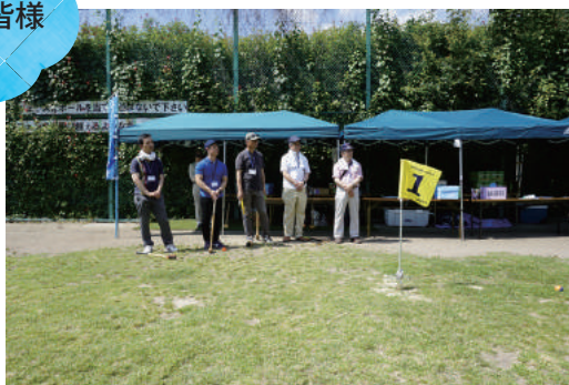
(右から) 西新井会、葛飾会、向島会、平安祭典、火災共済様