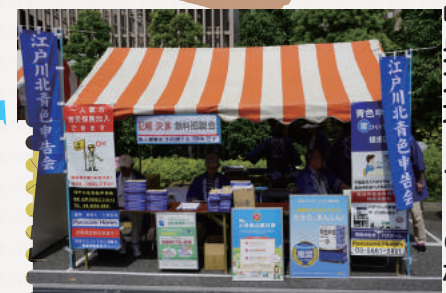
中央地域まつりの様子