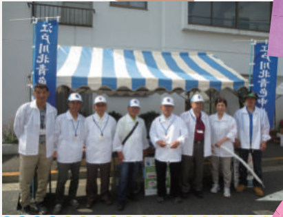
平成 30 年 5 月 27 日