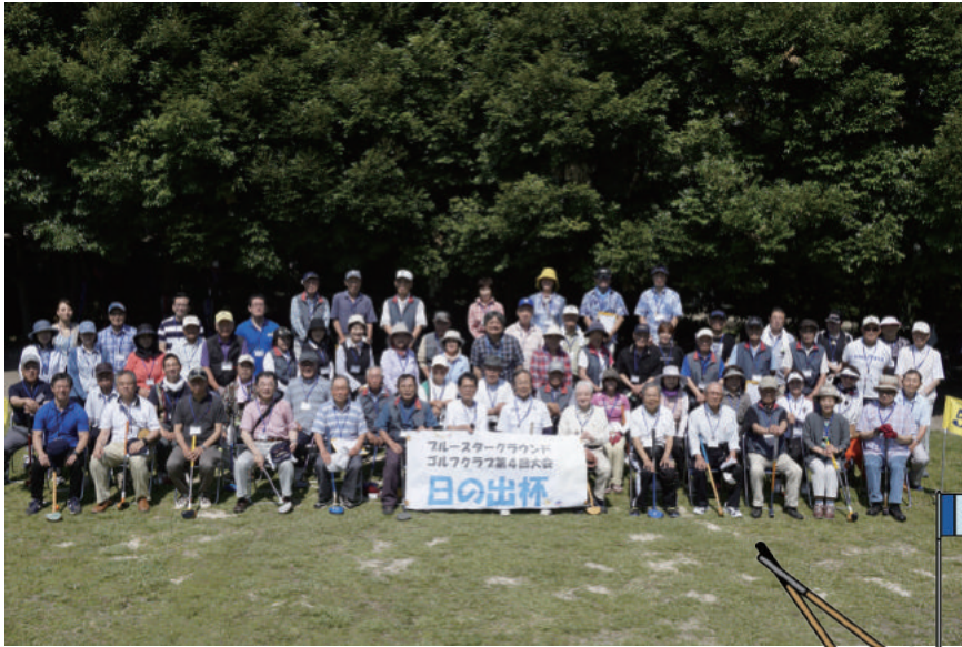
当日の参加者の皆様