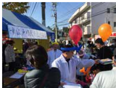
東部地域祭りの様子

11月13日（日）東部地域まつりが開催されました。当日は、天候にも恵まれ多くの方が当会のブースに訪れました。皆様にアンケートにご協力いただき、青色申告や申告会について質問される方もいらして終日盛況なうちに終了しました。