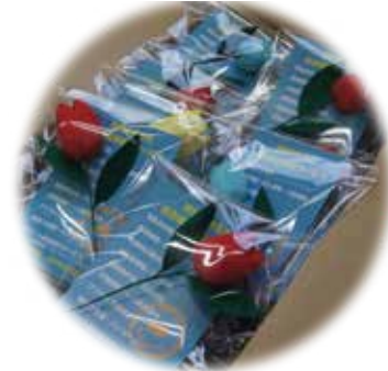
スマイルチューリップ

平成 28 年決算期のキャンペーン用品が出来上がりました。青色申告会でご案内している様々な福利厚生サービスに加入して頂いた方にお配りを致します。女性部の有志の方たちが一つ一つ丁寧に作成した「スマイルチューリップ」です。