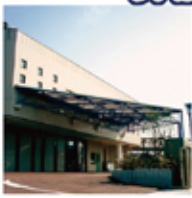
平安祭典 平安・篠崎 江戸川区篠崎町3-11-2