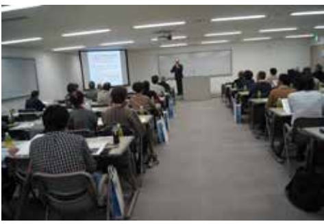
防災セミナーの様子

当日は、船堀タワーホール4階集會室でセミナーを開始、第一部「熊本地震と鬼怒川水害に学ぶ自然災害の備え」第二部「住まいづくりで考える・地震への備え」のテーマでした。どちらのテーマも「熊本地震」が挙げられ、現地での写真や実際の熊本地震の体験談などを聞くことができました。今、ここで大きな地震に遭遇したらどこに避難するのが安全なのか。「自助」「共