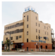
平安祭典 平安・小岩 江戸川区北小岩1-1-1