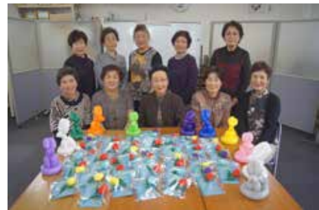
女性部有志の皆様