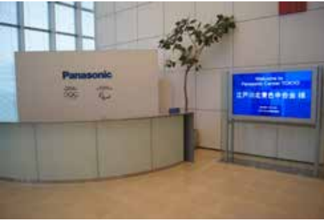
パナソニックセンターの様子