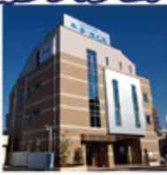
平安祭典 平安・相之川 市川市相之川2-6-14