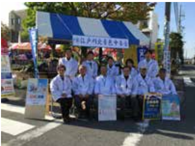
東部地域まつりに参加された皆様