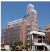
平安祭典 葛西会館 江戸川区東葛西8-3-12