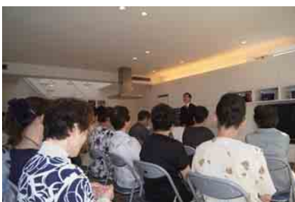
(写真上) マナー教室の様子