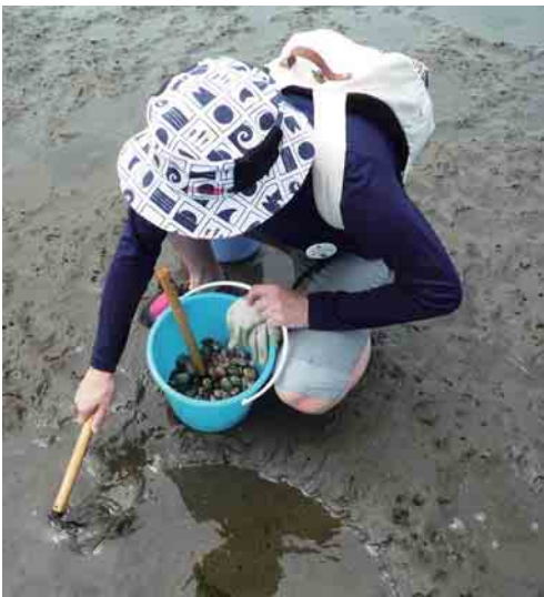
(写真上) 潮干狩りの様子

ANA機体工場見学では普段、なかなか見ることのできない機体点検の様子や最新機のボーイング787を間近で見ることができて参加者の皆様がとても満足して楽しんでいらっしゃる様子が印象的でした。今後も、青年部では夏休みに親子で楽しんでいただける体験型レクリエーションを企画していきます。来年も多数のご参加お待ちしております。